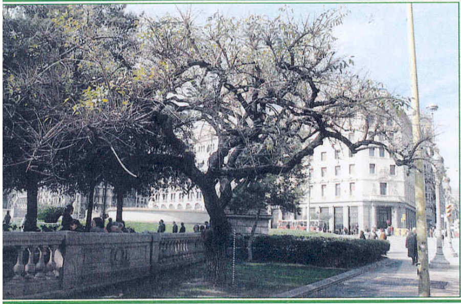
Erythrina crista-galli . Pl. Catalunya