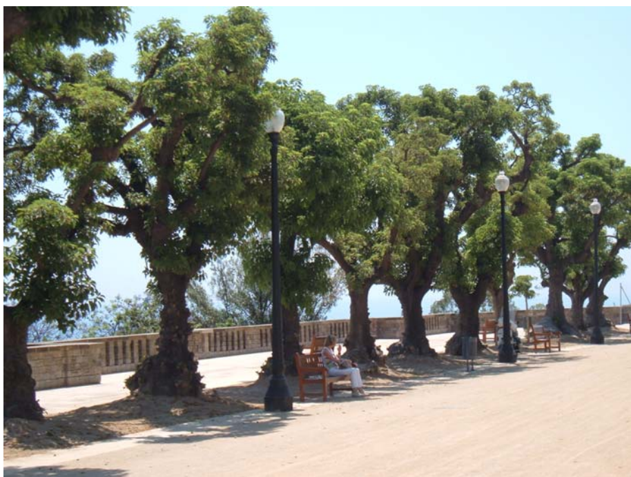
Conjunt de Phytolacca dioica catalogat. (Pl. De les Armes. Sants-Montjuïc)

El document que es presenta a continuació descriu el procediment a seguir en la catalogació d'arbrat.